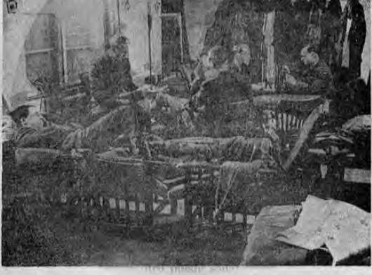
De un momento a otro puede sonar la señal que los llama a ocupar sus asientos en las cabinas de los cazas; mientras tanto, reposan, leen revistas o juegan a las cartas los aviaadores británicos en sus diferentes cuarteles en la tierra inglesa, por la que dentro de unas horas o unos minutos van a ofrendar su vida generosamente.